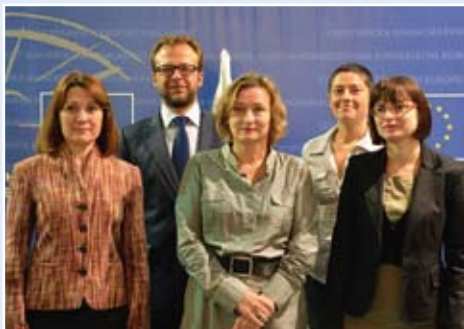
Екипът на Информационното бюро на Европейския парламент в България