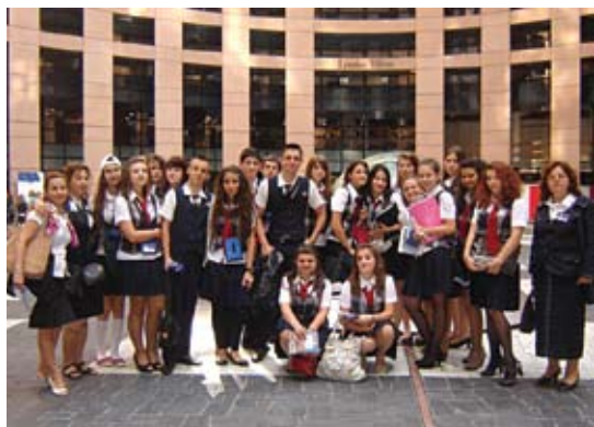
Участници в програмата «Евроскола» от ГПАЕ «Гео Милев», гр. Бургас в сградата на ЕП в Страсбург

(Из есета на участници в програмата «Евроскола», подадени за конкурса «Аз бях евродепутат за един ден»)