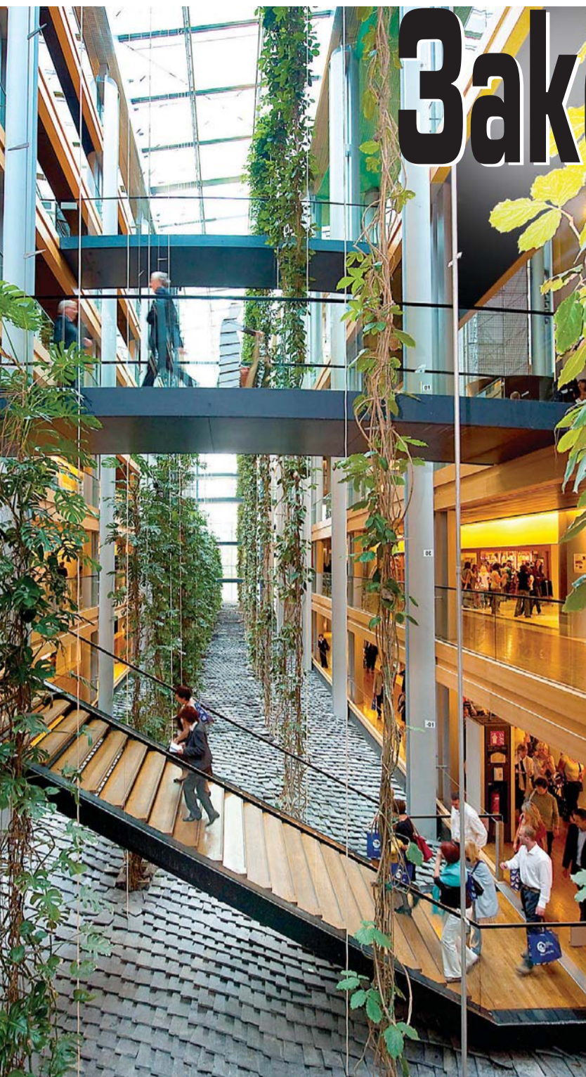
По дървените мостчета между коридорите евродепутатите „тичат“ към пленарната зала. Буйната растителност между корпусите успокоява страстите от лобирването в кулоарите.